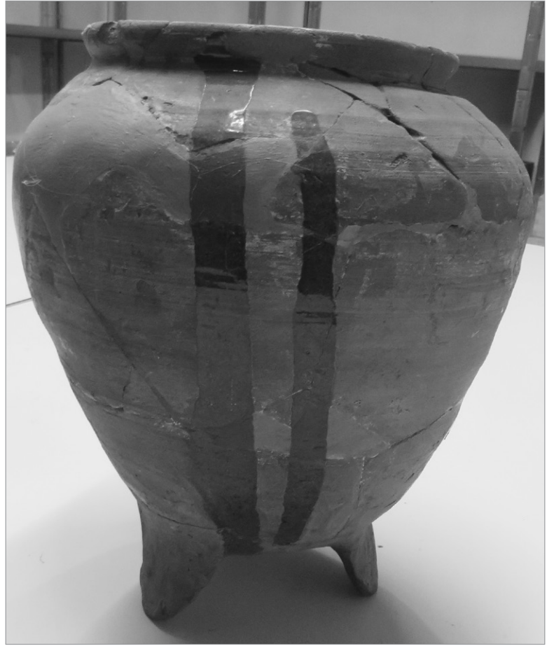
Wat is dit en hoe oud is het?

Bezoek dan Dorpsmuseum Dijkmagazijn De Heul