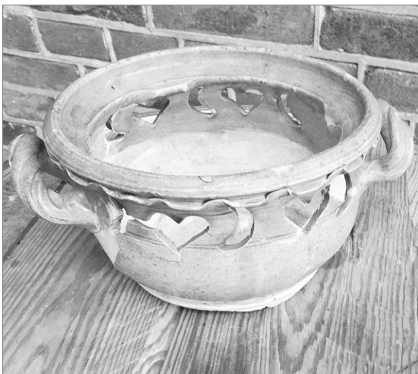
Het komfoor uit het Slijkerveerhuis van boven en van onderen gezien.

De bodem heeft drie (afgesloten) pootjes. Aan de cirkels in de bodem kun je afleiden dat het komfoor met een rechtsdraaiende beweging van de draaischijf is gehaald.