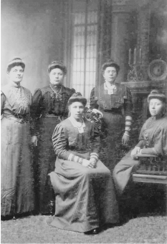
Bestudeer oude foto's