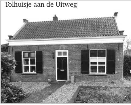
Tolhuisje aan de Uitweg

wijk, en het aantal wagens, dat in de sloot naast den weg terecht kwam, is niet te tellen. Gelukkig heeft de provincie de verbetering van deze weg thans krachtig ter hand genomen, op sommige plaatsen is zelfs een geheel nieuwe tracé ontworpen, waardoor enkele bochten afgesneden zijn. Over enkele weken zal deze bocht tot het verleden behoren en is er tusschen Houten en Schalkwijk een moderne weg met een prachtig wegdek tot stand gekomen.'