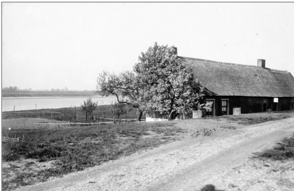
Veerhuis Oud-Slijkerveer aan de Lekdijk, vindplaats van de het komfoor.

De winnaar met de meeste goede antwoorden is Wout (geholpen door zijn moeder). Gefeliciteerd Wout. We zullen zijn moeder ook een mailtje sturen.