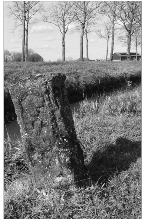
Mussertpaal aan de Trip

Een stap in de goede richting, maar... we zijn er nog niet. <<