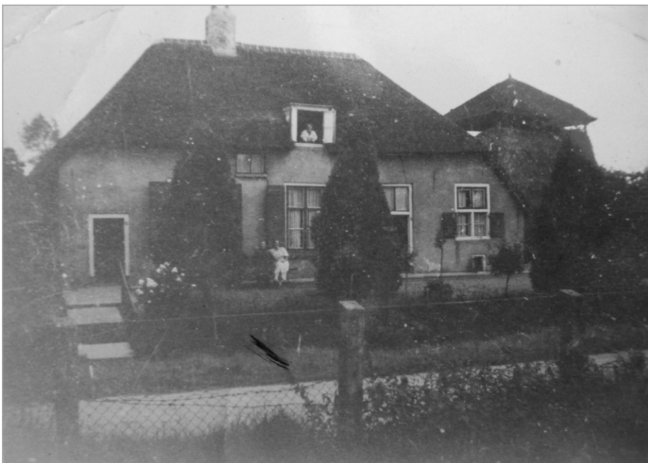
De familie Nieuwhoff bij het huis aan de Waalseweg 47

Het gezin Nieuwhoff kende ook tragische verhalen, zoals dat van Eliza Jacobus Nieuwhoff , geboren op 25 januari 1851 in Tull en 't Waal. Hij was schippers-