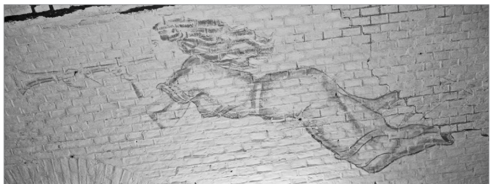
Muurschildering in het Werk aan de Korte Uitweg

Ridderhofstad Schalkwijk. Prominent aanwezig in de vaste tentoonstelling is de grote maquette van het Kasteel van Schalkwijk .