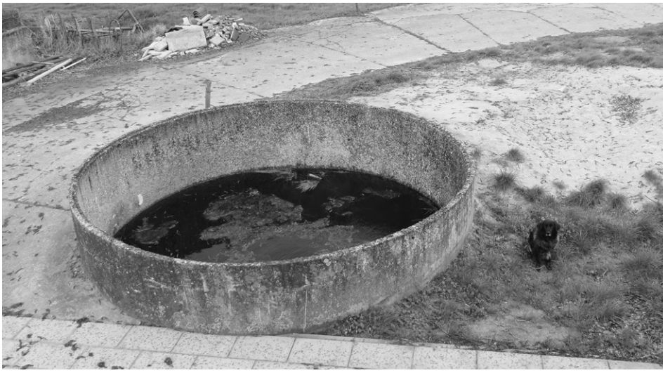
Silo o.a. voor Hardelandmethode