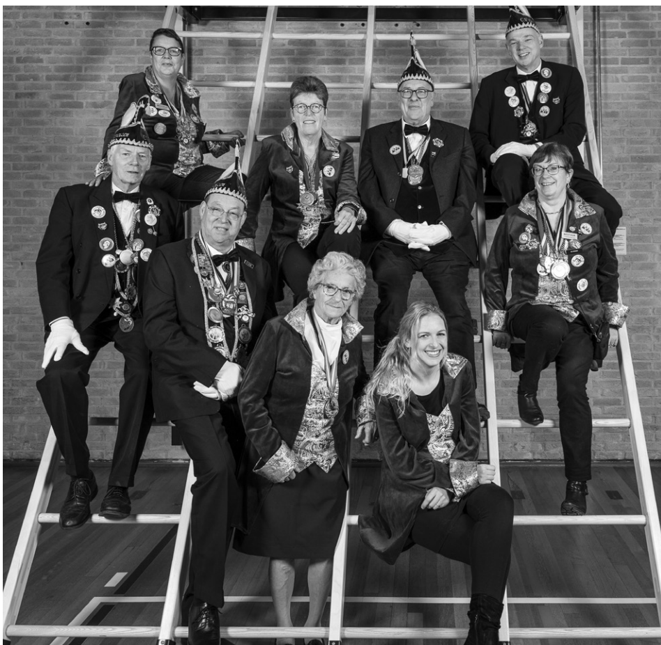
Senaat van de Platneuzen in 2019

De tentoonstelling over de Platneuzen is voor de laatste maal te zien op zondag 28 april 2024.