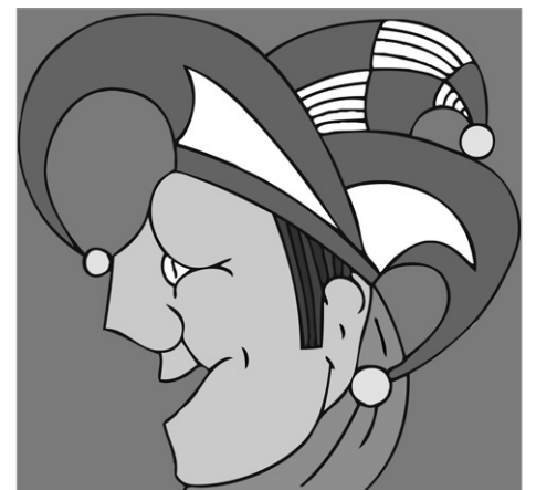
Het logo van de Platneuzen, gemaakt door Willy Kruijssen

In de beginperiode wilde iedereen aan het carnaval 'ruiken'. Al gauw werd er van vrijdag tot en met dinsdag carnaval gevierd! Maar na een aantal jaren was het nieuwtje er wel vanaf en vertrokken Raadsleden weer net