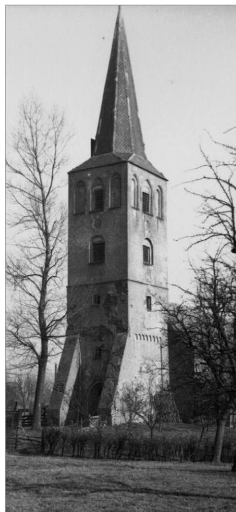
Toren van de NH kerk op de Brink in 1948