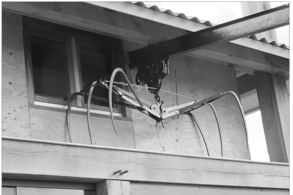
Hooigrijper waarmee het losse hooi van de wagen in de hooiberg werd gehesen

En aan die mensen vroeg ik eerst “kunnen jullie dan op die tijd voor mij melken en voeren?” Want als dat niet kon, plande ik mijn vakantie niet. Eerste kwaliteit melk wordt het beste betaald. Als je geen eerste kwaliteit melk hebt, of je hebt een keer penicilline in de melk, dan wordt je gigantisch afgestraft door de fabriek. En dan kost jouw vakantie niet jouw vakantie en de vervanging maar dan kost het je een paar keer een maandsalaris.”