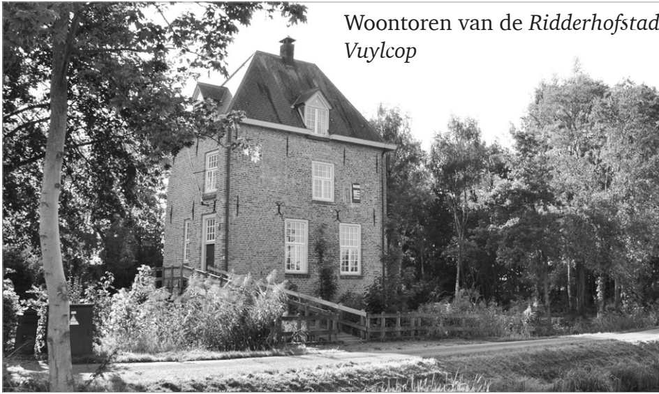
Woonstoren van de Ridderhofstad Vuylcop

• Monumentaal zijn ook de huisjes van de 'Langstraat'. Deze staan sinds meer dan 100 jaar op de Brink in Schalkwijk.