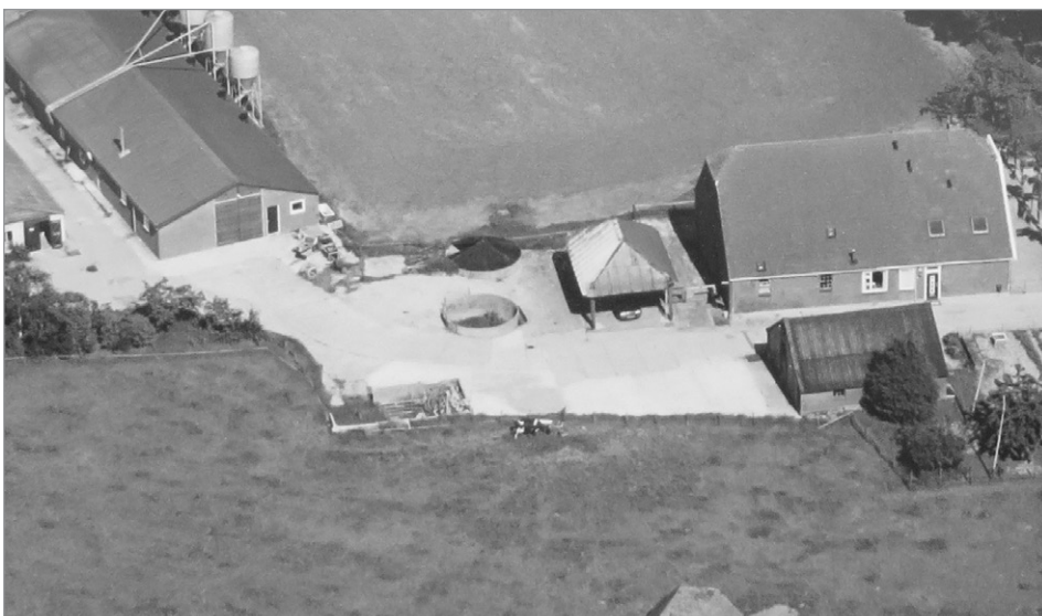
Boerenbedrijf Grijpestein ca 1994-2013